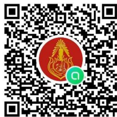
QR code ข้อมูลประชาสัมพันธ์การรับสมัคร

ให้ผู้ประสงค์จะสมัครขอรับใบสมัครและยื่นใบสมัครด้วยตนเองได้ที่โรงเรียนปากช่อง ที่อยู่เลขที่ ๑๓๗ ถนนนิคมลำตะคอง ตำบลหนองสาหร่าย อำเภอปากช่อง จังหวัดนครราชสีมา หรือส่งใบสมัครพร้อม Resume ได้ที่ Email : eppakchong@gmail.com ตั้งแต่วันที่ ๑๙ - ๒๕ เดือน เมษายน ๒๕๖๗ ตั้งแต่เวลา ๐๘.๓๐ น. - ๑๖.๓๐ น. (เว้นวันหยุดราชการ) โทรศัพท์ ๐๔๔-๓๑๑๐๙๘